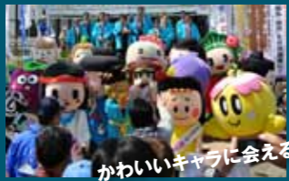
かわいいキャラに会える

◎個性豊かなご当地キャラクターが集結! ◎奈良県明日香村を拠点に活躍する「あすか劇団『時空(じくう)』」による、演劇ステージも見逃さない! (歴史博物館と難波宮跡公園で各1回予定) ※写真はイメージ