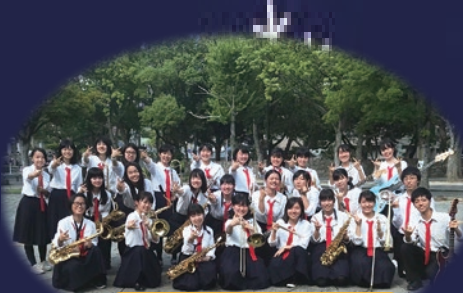
泉陽高等学校 軽音楽部