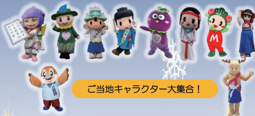
ご当地キャラクター大集合!