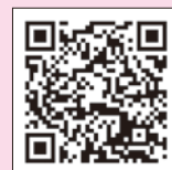
eL-TAX 地方税ポータルサイト