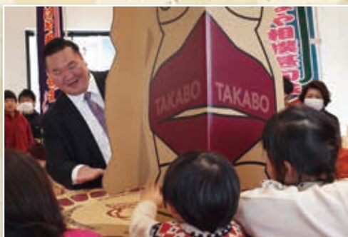
▲ 段 DAN 相撲で子どもたちと対戦