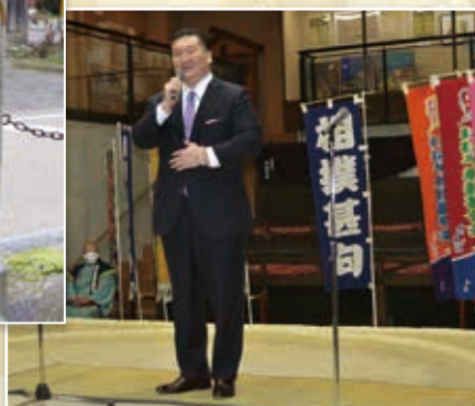
▼ けはや祭りに参加