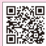
地方税お支払サイト

対応する金融機関やスマホ決済アプリなどについては、下記のサイトをご確認ください。