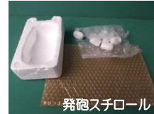
発砲スチロール トロ箱やプチプチなどの緩衝剤