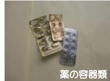
薬の容器類 錠剤を包んだ容器類