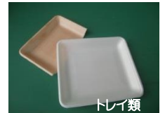
トレイ類 生鮮食品などの容器類(色付きも可)