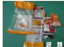
袋類 お菓子や冷凍食品などの袋やレジ袋