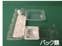
バック類 卵、野菜、豆腐などの容器