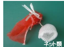
ネット類 果物・野菜など包んだネット