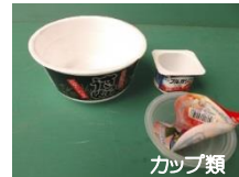
カップ類 カップ麺、プリンやヨーグルト容器