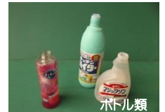
ボトル類 シャンプー・洗剤ボトル類 ※キャップやポンプは外して一緒にの袋へ