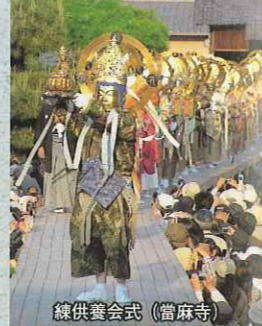
練供養会式(當麻寺)