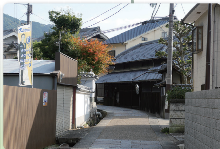
歴史資料館 太子町