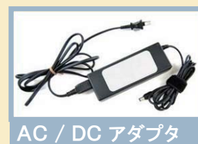
AC / DC アダプタ

長 く使用されている扇風機で、 次のような症状が見られる場合は、経年劣化による発煙・出火の恐れがあります。直ちに使用を中止してください。