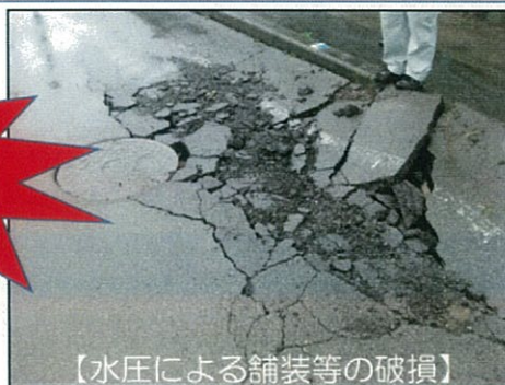
【水圧による舗装等の破損】