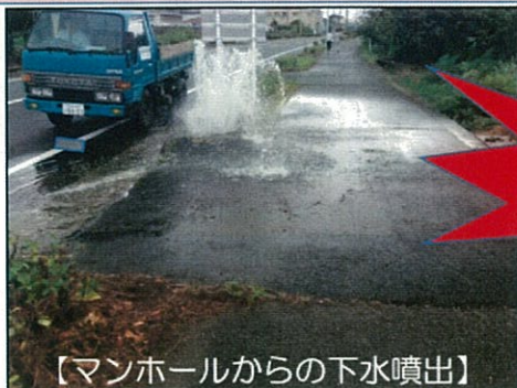
【マンホールからの下水噴出】

【原因】 雨水を流す雨樋などの排水が、「污水管」につながれていることや雨天時に汚水ますの蓋を開けて宅内の雨水を排水していること等が原因です。