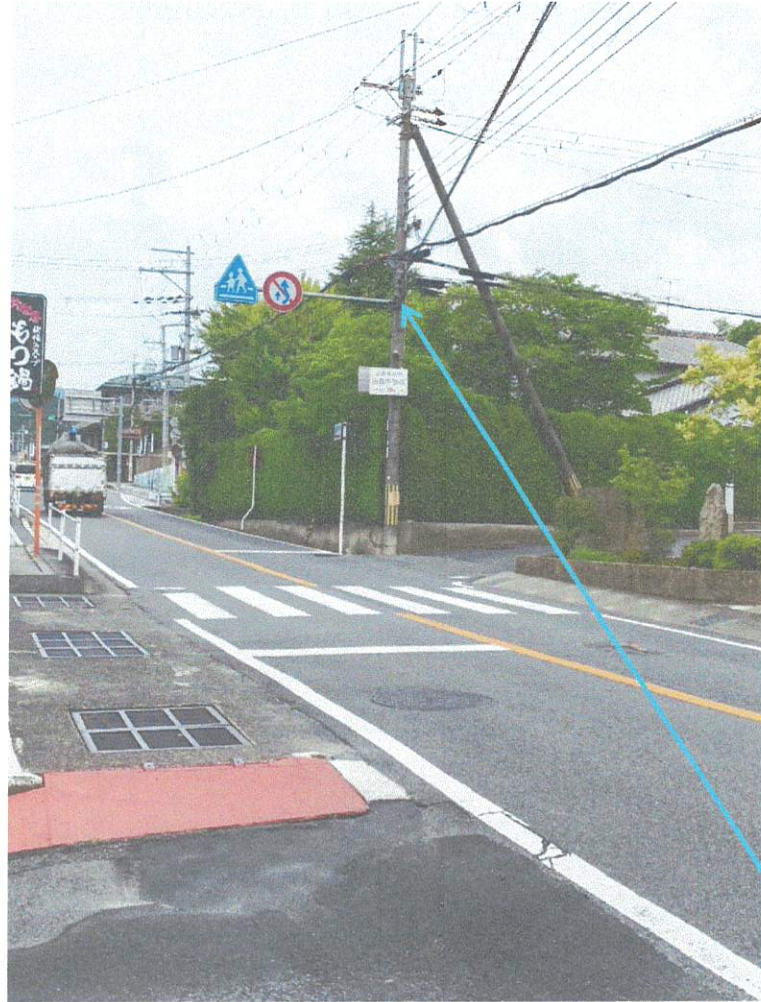
山松(もつ鍋)交差点