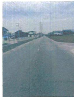
バイパス側から南方面を望む

にも拘わらず、スピードを落とさない、止まらない車両も多いため、横断歩道やハンプなどの設置を検討していただけると幸いです。