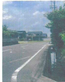
バイパス方面は緩やかなカーブで見えない