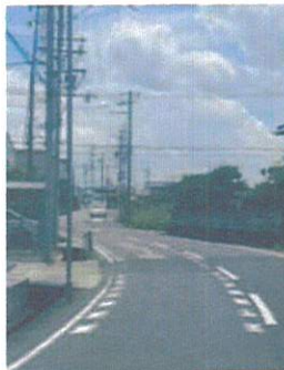
バイパス側からも児童は見えない(車両目線)