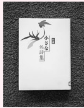
特選 小さな名詩集