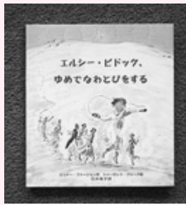
エルシー・ピドック、ゆめでなわとびをする エリナー・ファージョン / 作 シャーロット・ヴォーク / 絵 石井 桃子 / 訳

日常生活での心の変化、感情の起伏などを見事にすくいとつた詩という小さな作品の中には、それを読むひとりとりの広い世界が広がっています。あなたにもどうかみつかりますように。