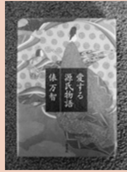
愛する源氏物語 俵 万智 / 著

源氏物語に登場する和歌の中から特に優れた作品を、歌人の俵万智が選び出し、現代語で詠み直すという方法で、素晴らしい和歌の数々を紹介しています。また、俵万智ならではの訳が付けられており、読者を楽しませながら古典の世界へ誘ってくれる一冊です。