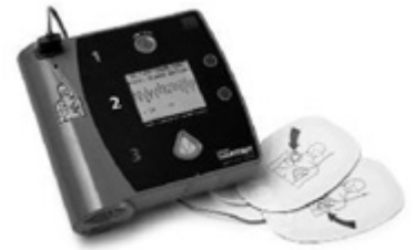
(A E D)