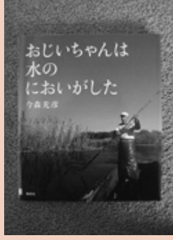
おじいちゃんはお水のおいがした 今森 光彦 / 著

源氏物語に登場する和歌の中から特に優れた作品を、歌人の俵万智が選び出し、現代語で詠み直すという方法で、素晴らしい和歌の数々を紹介しています。また、俵万智ならではの訳が付けられており、読者を楽しませながら古典の世界へ誘ってくれる一冊です。