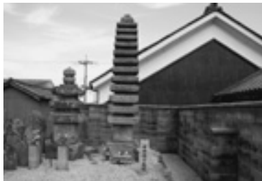
（中将姫の墓塔といわれる五輪塔）

また、江戸時代に墓地には三昧聖（尊称）と呼ばれる人々がいましたが、これは墓地を管理し、墓郷村々の葬送を司った人たちでした。三昧聖は行基の弟子志阿弥の子孫と称し、生と死の間の世界を管理できると考えられていました。（人権政策課）