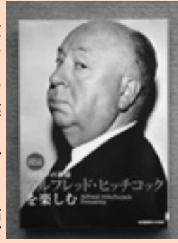
アルフレッド・ヒッチコックを楽しむ 小杉 修造 / 編

世界中の映画ファンを怖がらせたスリラーの神様「アルフレッド・ヒッチコック」。そのライフ・ストーリーと来日記、俳優への演出風景や作品のあらすじと解説を付したフィルムグラフィック、フアンを楽しみのひとつにもなつた自作出演シーン、各作品の鑑賞の手引きを収録しています。ヒッチコックが八十歳で他界して、もうすぐ二十七年を迎えます。今なおファンを惹きつけて離さない魅力を存分に楽しみたい。ださ。