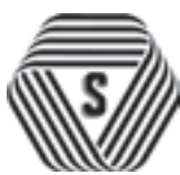
厚生労働大臣認可

厚生労働大臣認可の約款に従って営業することを登録した、「理容店」、「美容店」、「クリーニング店」、「めん類飲食店」、「一般飲食店」では、店頭でSマークを掲げています。登録店は、安心・安全・衛生を約束する信頼できるお店です。