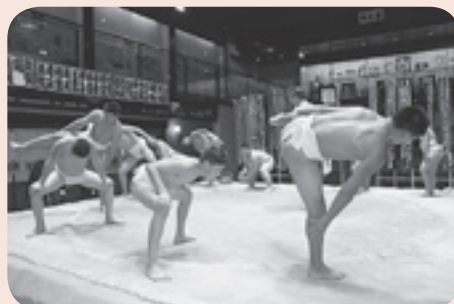
モンゴル相撲連盟のみなさん