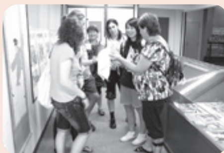
リスモー市の交換留学生のみなさん

インバウンド（外国人観光客の誘致）政策の推進を図るため、外国人観光客等（海外からの長期滞在者や留学生などを含む。）の入館料を無料化している相撲館の外国人入館者が増加しています。