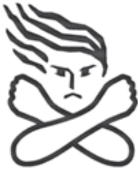
女性に対する 暴力根絶のためのシンボルマーク

毎年、11月12日から25日までの2週間、「女性に対する暴力をなくす運動」が実施されています。(11月25日は「女性に対する暴力撤廃国際日」です。)