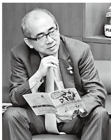
Profile 溝畑 宏 / Mizohata Hiroshi 昭和35年8月7日生 京都府出身 平成22年から観光庁長官