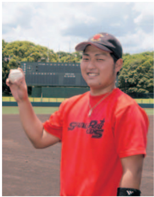
大和侍レッズ キャプテン