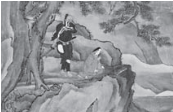
ひばり山の山中で、武士に討たれようとする中将姫(中巻より)

当代随一の絵師と能筆家たちの大和絵と詞書とのコラボレーションによる縁起絵巻の代表傑作を、ぜひこの機会にご観覧ください。