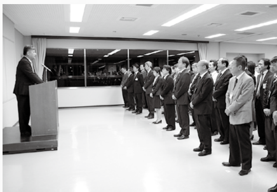
全職員を前に訓示を述べる

1 期目の4年間では、タウンミーティングの開催をはじめ各地区での行事等にもできる限りお伺いし、一人でも多くの市民みなさまと触れ合う機会をもち、意見交換できるようにと努めてまいりました