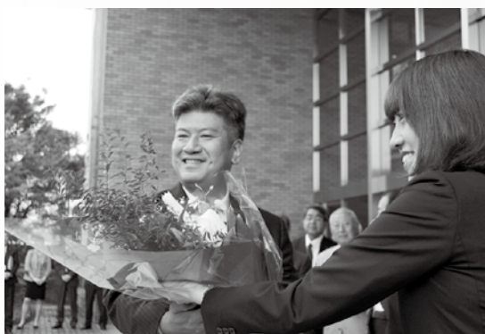
初登庁、花束を受け取る

市 民のみなさまの力強いご支援と熱いご支持を受け、再び市政を担わせていただき、葛城市長として2期目の公務をスタートいたしました。今一度初心にかえって、私たちの愛するまち葛城市のために気力・体力・知力の限りを尽くしてまいります。