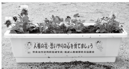
花を植え、育てる中で人権意識の高揚を図る、「人権の花」運動が市内の5小学校で行われました。