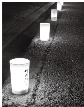
長尾に並んだ無数の灯火カップ