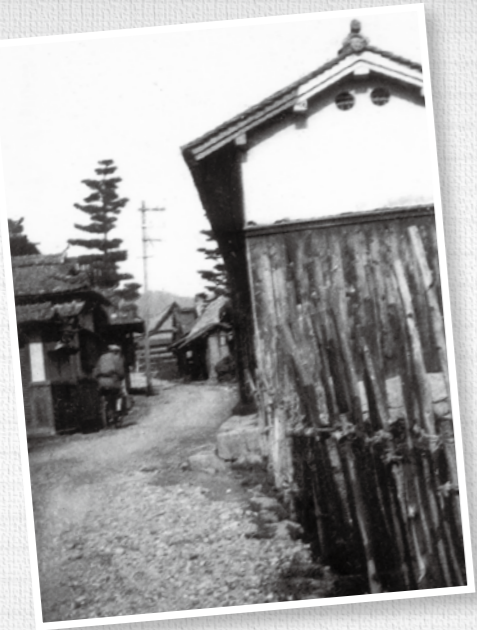
長尾から竹内に上る街道部分【大正～昭和初期】