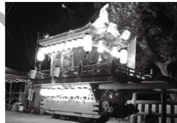
ライトアップされるだんじり