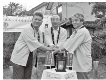
明日香村へ灯りを引継ぎました