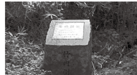
⑪竹内峠 (うぐいすの関)

大阪と奈良の県境。峠の西にある孝徳天皇陵は嘗陵の別名があり、この一帯はうぐいすの名所であった。