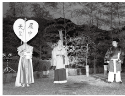
『竹内街道物語』の寸劇に歓声