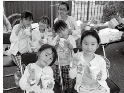
みんなでかき氷を食べたよ！