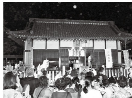
長尾神社の境内に響く演奏