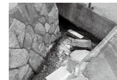
今も残る洗い場 炊事や洗濯などに利用した。

熊谷川に堰を設け農業用水を確保するとともに、水路に洗い場を作り日常生活にも利用しました。今思えば先人たちは、生活に密着するすばらしい工事をされたのだなあと感心・感謝ですね」