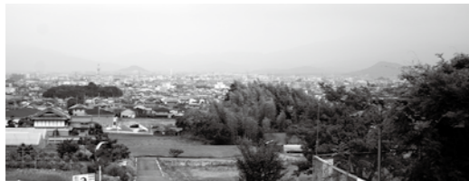
⑨大和三山遠望 (畝傍山、天香具山、耳成山) 東を向けば大和三山が見える、眺望スポット。

昔から水が豊富だった竹内の源泉。川は竹内を越えて當麻へ、葛下川を経て大和川へと注ぐ。