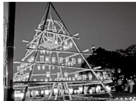
キャンドルの灯りがゆらめきます