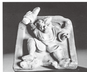
<宇陀松山城鬼瓦（雷神）>

本特別展では、大坂城を守る大和の城と、大坂城を攻める伊賀、伊勢の城について展示を行います。