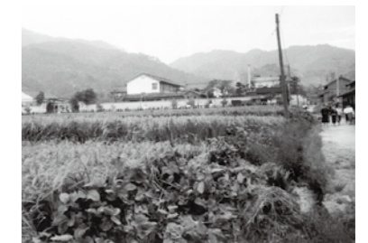
昭和30年代の竹内街道

内の人々にとって生活の道。その景観と自然、芭蕉ゆかりの俳句文化を大切に守りながら、この地を訪れる人々をあたためたいと思います」