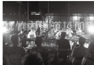
キャンドルに囲まれてのライブ