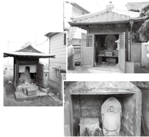
⑤街道沿いのお地藏さん