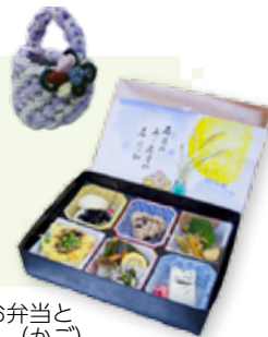
美しい絵手紙付きのお弁当と 敬老の日のプレゼント（かご）

ふたば会では、配食サービスの他にも施設の慰問、バザー の開催、ゆうあいステーションでの抹茶接待などの活動 をしています。詳しくは、 社会福祉協議会 ☎ 0745(48) 3373 までお問い合わせください。