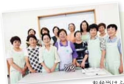
お弁当はふたば会の皆さんが作った後、地域 の民生委員の方がお年寄りの家へ届けます。

「信頼できる仲間にもまれて、 毎日とても充実しています。今後 はより地域に密着した、きめ細や かなボランティア活動を行ってい きたいですね」