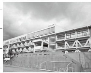
耐震化が完了した新庄中学校