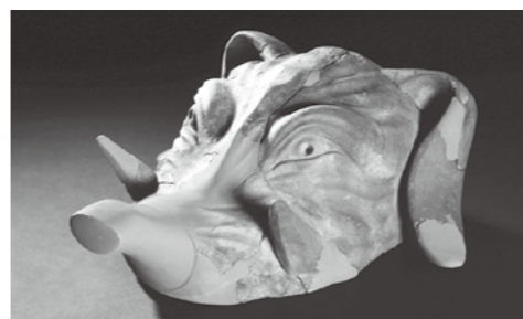
宇陀松山城 象形瓦製品

本特別展では、大坂城を守る大和の城と、大坂城を攻める伊賀、伊勢の城について展示を行います。