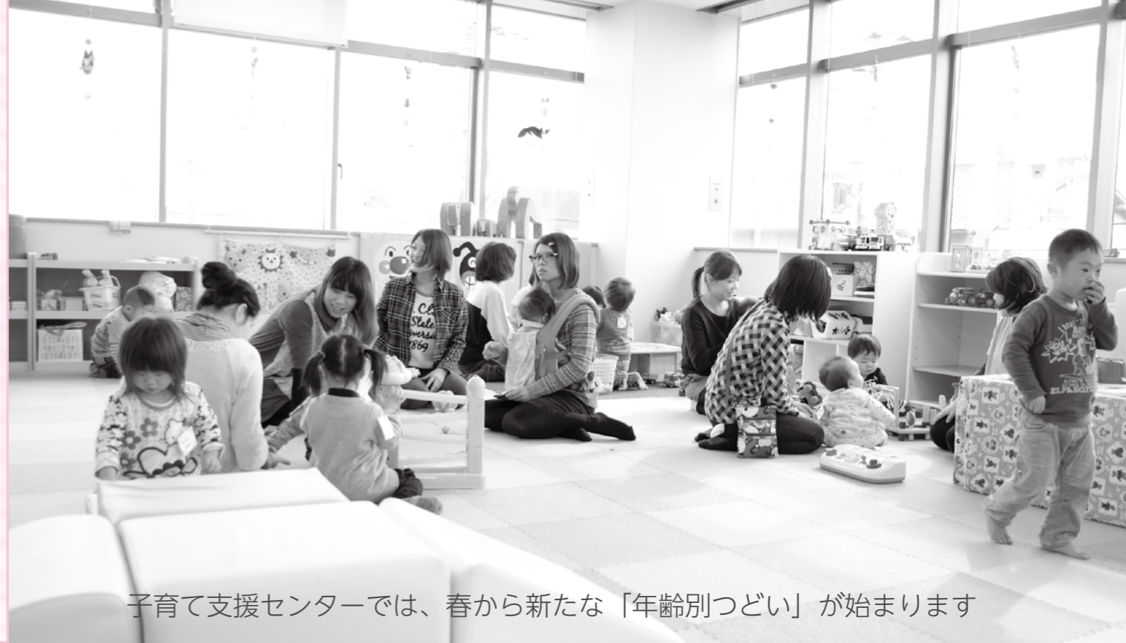
子育て支援センターでは、春から新たな「年齢別つどい」が始まります