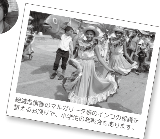
絶滅危惧種のマルガリータ島のインコの保護を訴えるお祭りで、小学生の発表会もあります。