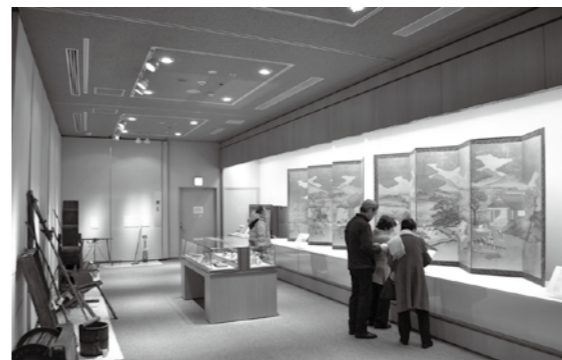
▲冬季企画展『農家の四季－祭礼と耕作図－』展示風景

当企画展では、過去の暮らしの中から、特に、大和盆地(国中)の主な生業であった農業(稲作・畑作)に注目し、先人たちの知恵や苦勞、農業に込められた祈りを振り返ります。