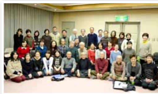
肩の力を抜いて、良い姿勢で歌いましょう♪

「当麻混声合唱団の皆さんからはいつも元気をもらっていて、本当に感謝しています。歌があるからこの歳になっても元気でいられるのだと思いますね。現在は50周年のコンサートに向けて、『水のいのち』という曲等を練習しています。葛城市民の方をはじめ、たくさんの方にきてほしいですね」