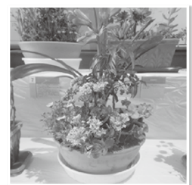
最優秀賞 寺田久子（長尾） 『我が友』