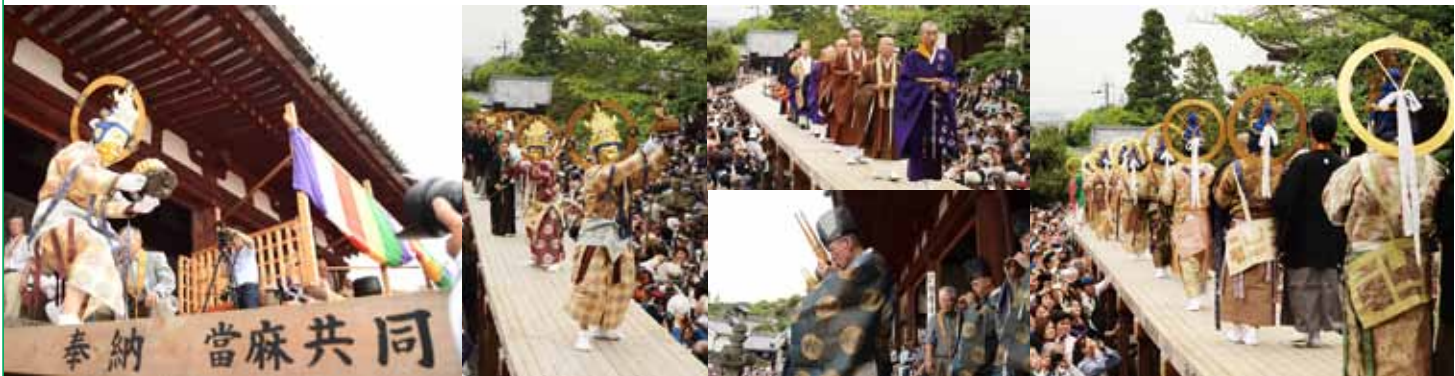
今年の練供養より

お店が出るこの日をとても楽し みにしていました。今は無事に終わ るのを見届けることが第一です。 講とお寺が協力してこの伝統行事 を次の世代につないでいってほし いですし、菩薩役を引き受けた方 は責任を持ってその任務を全うし てほしいと思います」