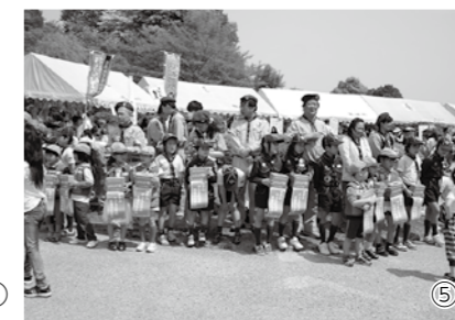
①ミス・サリバンさんの迫力あるジャグリングパフォーマンス②超新星スバルファイブも舞台上で活躍③幼稚園の先生による和太鼓「蓮花」④葛城市民劇団「風塾」による「ジャックと豆の木」⑤小さなボーイスカウトたちが一生懸命募金活動に励みました