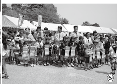
①ミス・サリバンさんの迫力あるジャグリングパフォーマンス②超新星スバルファイブも舞台上で活躍③幼稚園の先生による和太鼓「蓮花」④葛城市劇団「風塾」による「ジャックと豆の木」⑤小さなボーイスカウトたちが一生懸命募金活動に励みました

ゴールデンウィークということもあって家族連れの姿も多く見られ、新緑の美しい屋敷山公園で楽しいひとときを過ごされました。