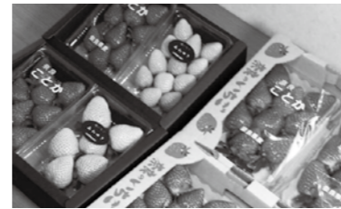
▲白イチゴ一度ご賞味ください！

駅などに出荷しています。新しい道の駅ができれば、県外にもアピールして認知度を高めてもっと多くの人に私のイチゴを食べてもらえると期待しています。そして将来は、脇田に直売所を作りたいですね」