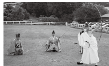
▲矢を放つ瞬間、緊張が走ります

「葛城市は地域の人々のつながりが活発で、私も少しずつでも地域と関わっていきたくです。将来は葛城市に弓道場を建てるのが私の夢なんです。私が学んできた伝統と文化を次の世代につないでいきたいと思っています」