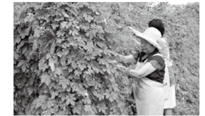
▲ゴーヤも自家栽培しています

になったものや、無添加無農薬にこだわった加工品など皆さんに愛される道の駅であり続けたいと思っています。今後は横のふらさと公園も含め一体化して遊べる施設として、ファミリー層を呼び込みたいですね」