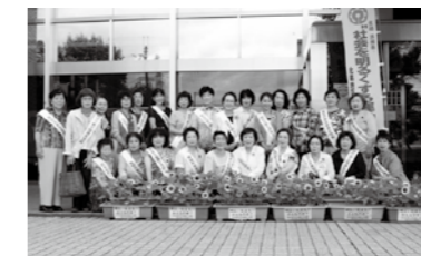
▲ひまわりが活動のシンボルです

動は、すぐに結果が出るというものではありません。それでも地域で必要とされ、地域の役に立ちたいという思いで活動しています。今後はこの活動に共感し、ともに活動していく仲間を増やしたいですね」