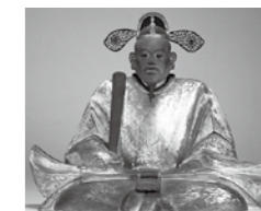
▲豊臣秀吉木像(宝樹院所蔵)