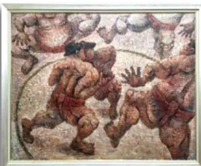
弓手研平「朝稽古」2015年作

「現在は私たちの主食である『白飯』などを題材に創作に取り組んでいます。これからも人間の原点を大切に、土のにおいや大地の温もりを感じる作品を目指していきたいですね」