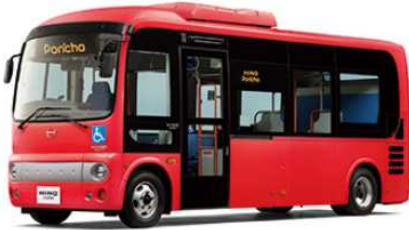
写真の外板色、方向幕の文字などは撮影用特別仕様です。