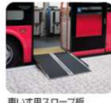
車いす用スロープ板 (撤脱式)