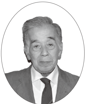
瑞宝単光章 消防功労 元葛城市消防団副団長