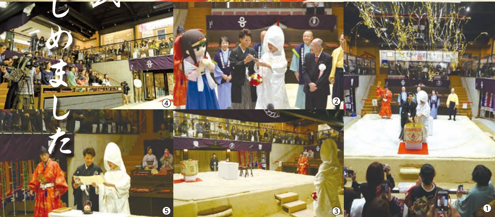
①鏡開きを行い、樽の中からクラッカーが出てきてびっくり ②2人のやりとりに皆微笑む ③土俵を挟んで、向かい合う新郎・新婦役 ④親族や友人、報道関係者などたくさんの方が来られました ⑤仲が良い夫婦になることを誓っています