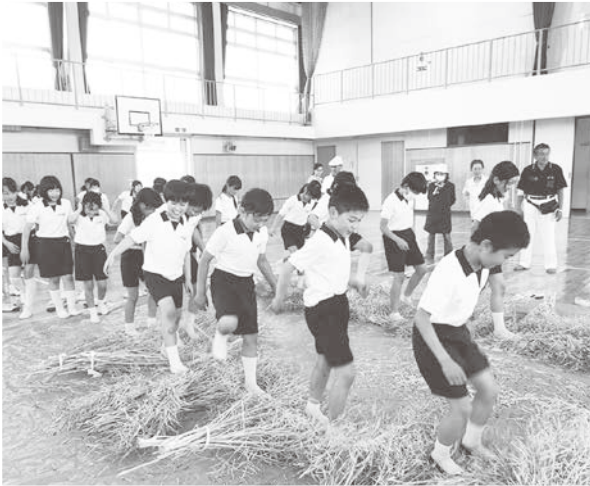
菜の花プロジェクト

今年度もたくさんのゲストティーチャーに来ていただき、さまざまな経験をしました。今回はその中で4年生の学習を紹介します。