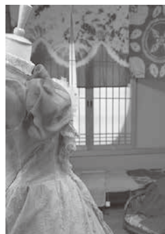
ウェディングドレスのイベント

12月2日には、當麻寺宗胤院 そいんにん で作品展示や藍染のウェディングドレス(22ページ参照)試着体験などのイベントを開催。皆さんも、ぜひ本物の藍染を体験しに来てください。