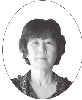
瑞宝単光章 看護業務功労 元奈良県立医科大学附属病院 看護部看護副部長

葛城市消防団副団長として、葛城市の防災活動、消防活動に活躍された功績により、瑞宝単光章を受章されました。