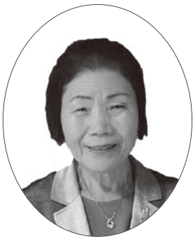
瑞宝双光章 教育功労 元公立中学校長

元新庄町議会議員および元葛城市議会議員として、地方自治の進展に貢献されたことにより、旭日小綬章を受章されました。