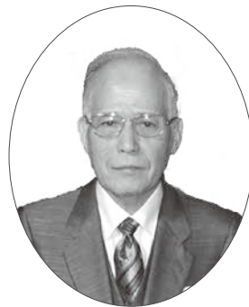
瑞宝双光章 警察功労 元大阪府警視

公立中学校長として、教育分野での進展に尽力されたことにより、瑞宝双光章を受章されました。