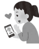
好きな写真 を見る