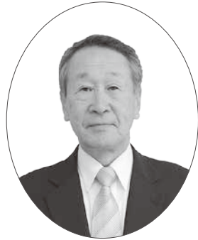
旭日小綬章 地方自治功労 元葛城市議会議員