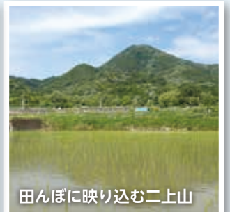
田んぼに映り込む二上山