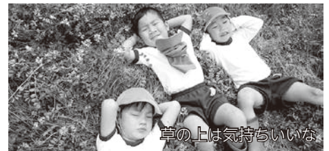
草の上は気持ちいいな

磐城第2保育所では、毎年、近所の方のご好意でれんげ畑を開放していただき、子どもたちが思いっきり遊ぶ機会を作っています。