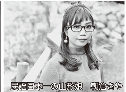
民謡日本一の山形娘 朝倉さや