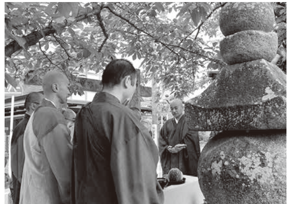
けはや法要の様子

ワンパク相撲大会・相撲体験の参加希望者は、6月6日(木)までに相撲館へ申し込みください。