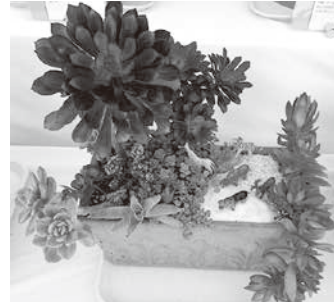
最優秀賞 「サバンナのオアシス」