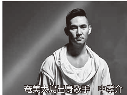
奄美大島出身歌手 中孝介

新鮮だけれど、どこか懐かしい。そんなシマ唄と民謡をルーツに持つ二人の美しい歌声で、名曲の数々をお届けします！