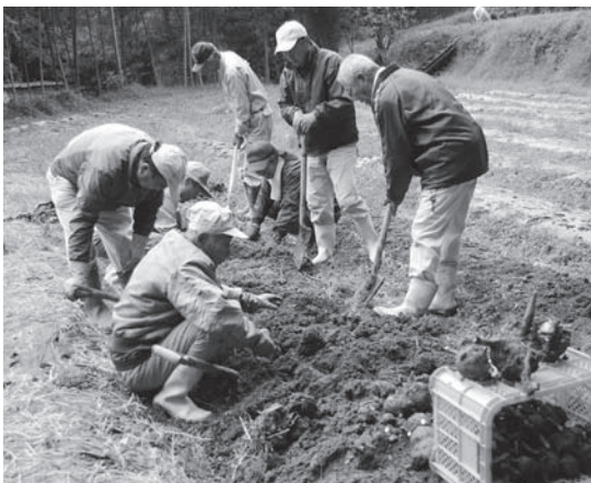
☎ 【平成27年度市民活動支援事業採択団体】 太田里山の会

道の駅かつらぎで販売中の「串コン」は、太田のコンニャク芋を加工して作られています。