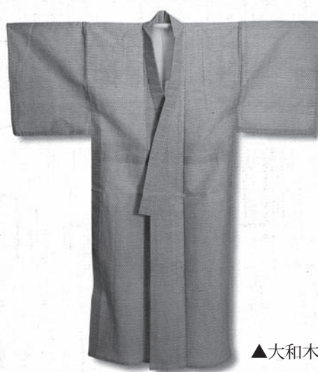
▲大和木綿：白緋浴衣

休館日 毎週火曜 / 第 2・第 4 水曜 年末年始 (12/27 ~ 1/4)