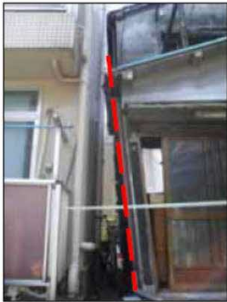
建物の傾きが明らかに確認できる例 （建築物の著しい傾斜）