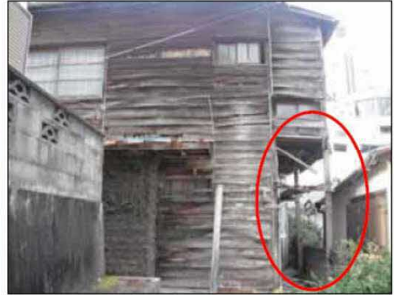
柱に局部的な亀裂やひび割れ等がある例 （柱、はり、筋かい、柱とはりの接合等）