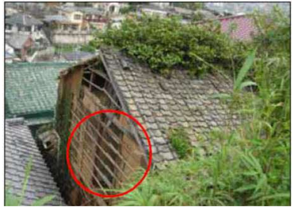
外壁の仕上げ材料が剥落、腐朽又は破損し下地が露出している、 壁体を貫通する穴がある例（外壁）