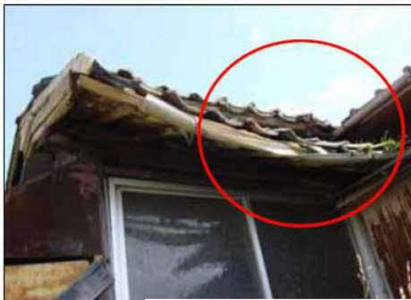
屋根が変形している、軒や雨樋が垂れ下がっており、落下飛散の恐れがある例 （屋根ふき材、ひさし又は軒）