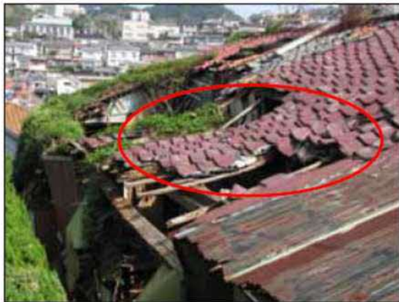
屋根、ふき材が剥落している例 （屋根ふき材、ひさし又は軒）