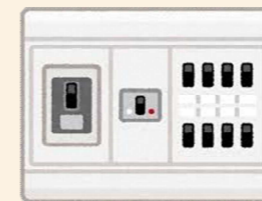
感震ブレーカー設置