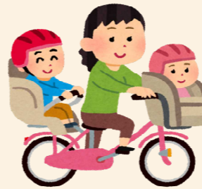
幼児 2 人用自転車購入