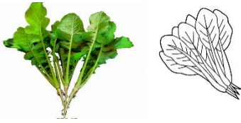
やまとまな・こまつな