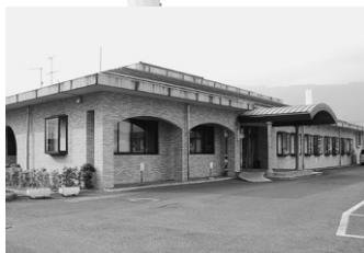
いきいきセンター