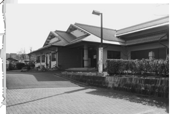
北花内コミュニティセンター