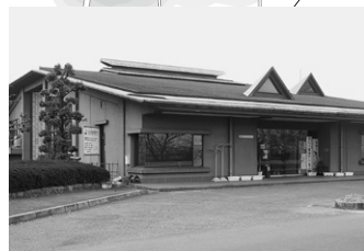
葛城市コミュニティセンター