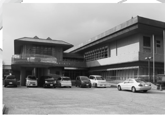
當麻スポーツセンター