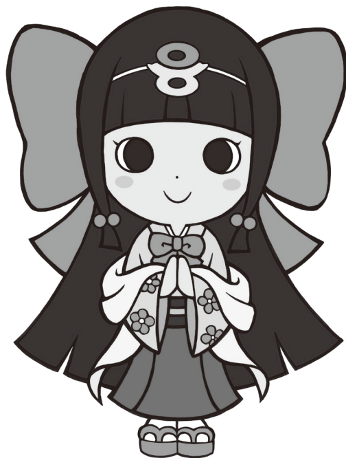
葛城市マスコットキャラクター 《蓮花ちゃん》