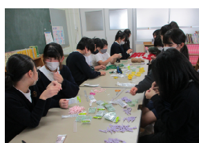
低学年下校班のリボンづくり