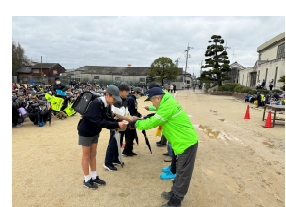
見守り隊さんへのお手紙贈呈