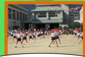
かっこよくポーズ！(2年)