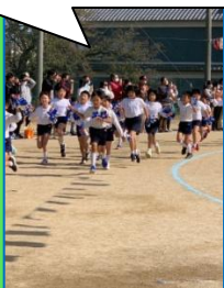
キュービーポーズ！(3年)