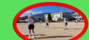
旗をまわってバトンタッチ！(1年)