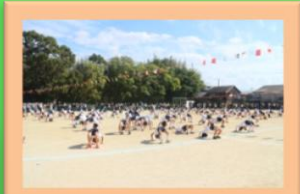
技をそろえました！(5年)