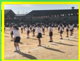
元気よく踊るぞ！(1年)