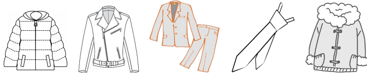
ジャンパー・革製の衣類・スーツ(上下)・ネクタイ・ブレザー・オーバー・コート