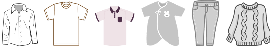
カッターシャツ・Tシャツ・ベビー用子供服・ジーンズ・毛糸のセーター