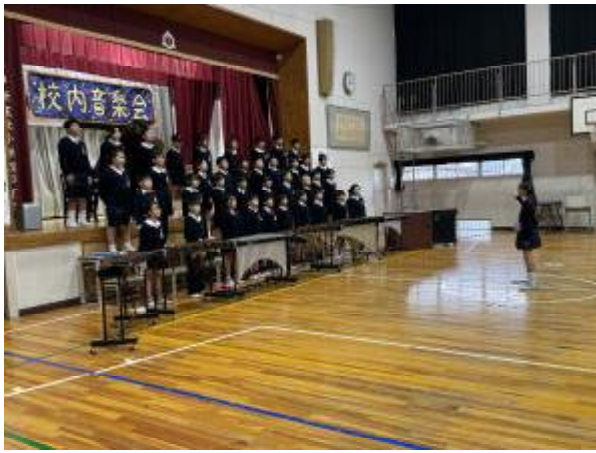
⑤ 5年生 合唱「夢の世界を」 合奏「アフリカンシンフォニー」