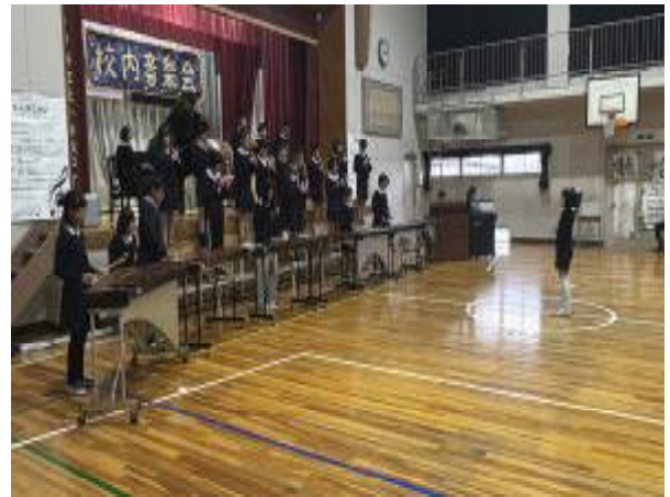
⑥ 6年生 合唱「いのちの歌」 合奏「アイネ クライネ ナハトムジーク」