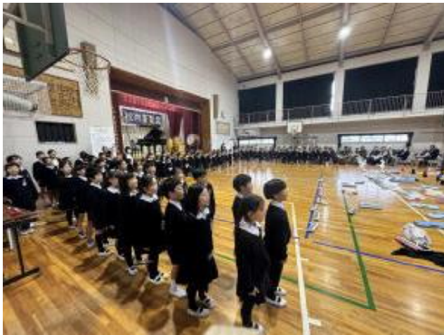
全体合唱「すてきな笑顔の花が咲く」

一部も二部も最後は、新庄北小学校の先輩たちが作詞した「すてきな笑顔の花が咲く」を大合唱します。