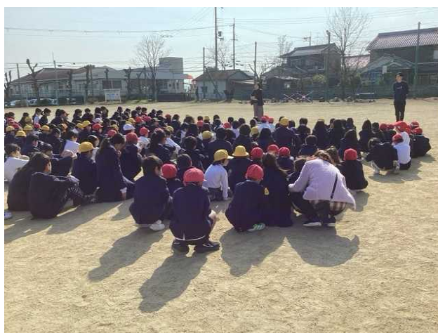
↑ 話を聴いています