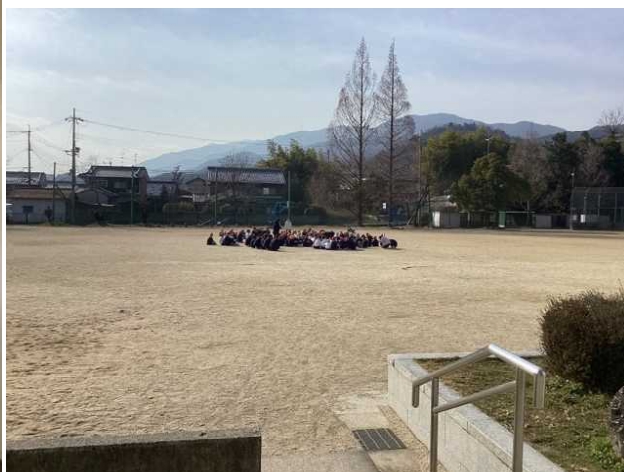
↑ 運動場の中央で姿勢を低くして避難