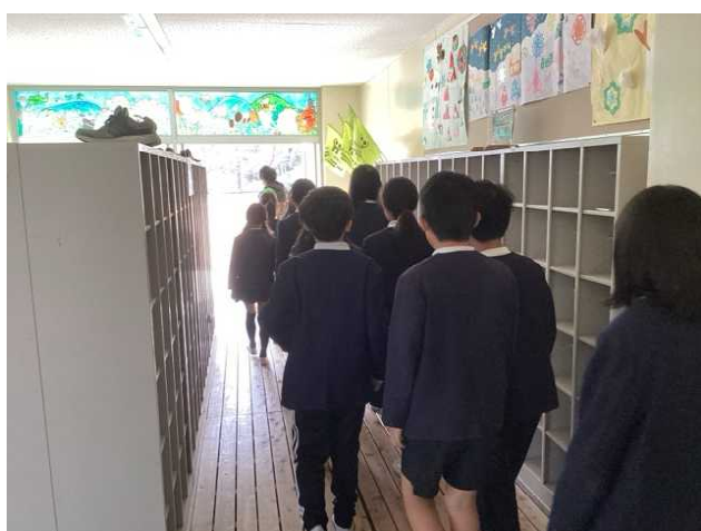
↑ 安全な場所に避難