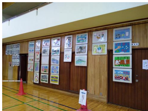
昨年度の作品展より

(実施日) 8月30日(水) 午前11時～午後5時 8月31日(木) 午前8時～午前11時