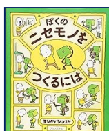
『ぼくのニセモノをつくるには』