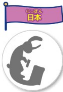
おもちをつくウサギ