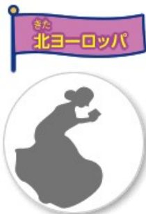
本を読むおばあさん