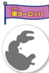
おんなひとよこがお 女の人の横顔