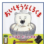
『おいしそうなしろくま』