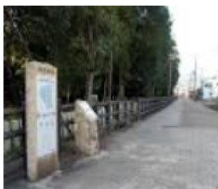
日本最古の官道（大道） 開通1400年