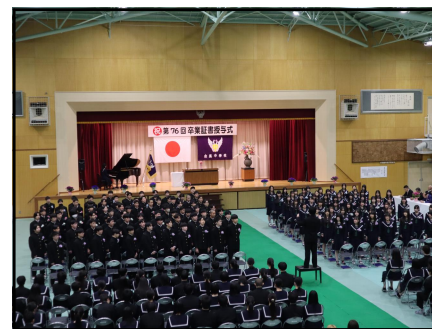
「旅立ちの日に」合唱

3月12日(木)、葛城市副市長をはじめ多数のご来賓、保護者、地域の皆さまのご臨席を賜り、第76回卒業証書授与式を挙行了しました。柔らかな春の陽ざしの中、たくさんの方々に祝福され、式は肅々と進行しました。